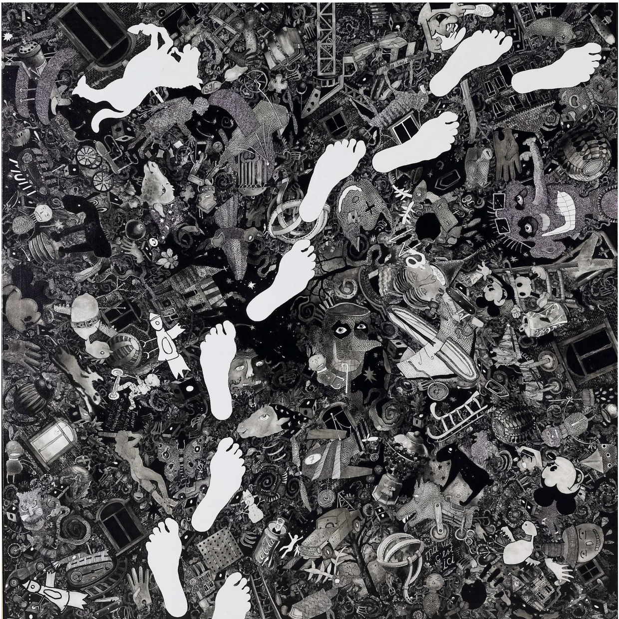
“cacola”, encre sur toile, 170x170cm. Christian Silvain

Silvain's pictures have been exhibited at several art fairs in Europe and USA. Silvain is represented in some fifty museums and public collections in Brussels, Anvers, Oostende, Tel Aviv, Paris, Nice, Dunkerque, Prague, Vienna, Ottawa, Amsterdam, Düsseldorf, and others.